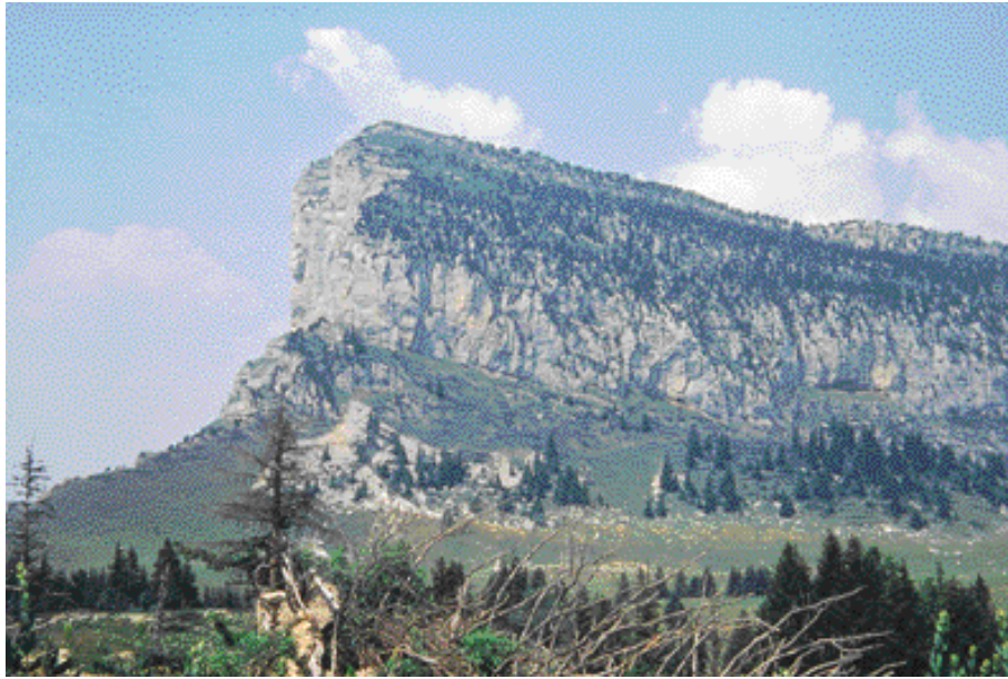
Le massif du Granier

C'est au nord-est, dans l'alpage voisin de l'Alpette, à environ 7,5 km au pied sud du Granier, que de nouvelles traces d'occupations préhistoriques viennent d'être récemment découvertes.