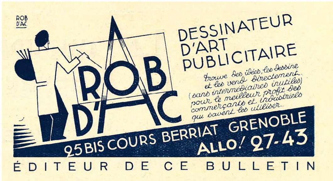
3. Logo de Rob d'Ac, extrait du Bulletin mensuel du groupement dauphinois de la Houille Blanche , n° 2, mai 1933.

« Gravez dans le cœur de votre client une marque sympathique présentée avec goût. Imprimez dans sa mémoire un mot remarquable. Fixez dans son œil une image forte, élégante, toujours originale, inoubliable. Cherchez en toute chose l'essentiel. Éliminez tout verbiage. C'est le rôle de la marque, petit signe mystérieux, prodigieux, qui fixera le destin de votre maison 3 . »