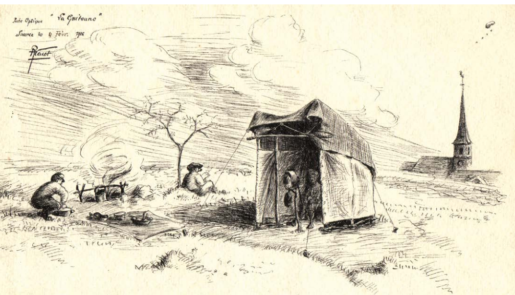
2. Robert Menot [Rob d'Ac], La Guitoune , dessin noir et blanc, 4 février 1916. © Les Amis de Rob d'Ac.

le magasin est tenu par l'épouse, tandis que le dessinateur s'installe sous l'escalier menant à l'appartement à l'étage. Toujours dessinant, il croque cyclistes du Tour de France, escrimeurs, pilotes de la course de côte de Laffrey, rugbymen du FCG (Football Club de Grenoble) et, dans le journal Les Alpes sportives , sont publiées ses caricatures de boulistes en plein concours. Ayant trouvé pseudonyme et logo (fig. 3), il se fait connaître comme « dessinateur d'art publicitaire, affiches, création de marques, dépliants, catalogues, annonces, tous dessins de publicité, chercher et trouver des idées qui vendent! ». C'est acté : le dessinateur et publiciste a définitivement pris le pas sur l'ingénieur.