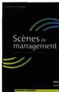
• SCÈNES DE MANAGEMENT Le théâtre au service de l'entreprise Laurent Lesavre, Ed. PUG, 2013.

Le théâtre peut être un outil au service de l'entreprise et une réponse à de nombreuses problématiques (situations de changement, conflits, stress, etc.). Le théâtre d'entreprise prend différentes formes qui offrent chacune un intérêt, de la représentation au théâtre forum. Le but est de véhiculer, d'initier une réflexion, un échange autour d'un enjeu, d'une pratique ou d'une situation propre à l'entreprise. Les principaux intérêts de ces techniques résident dans la dédramatisation des situations grâce à la théâtralisation, l'émotion véhiculée par le jeu des acteurs permet l'appropriation des sujets par le public et la plasticité des interventions offre au spectateur de devenir metteur en scène ou même acteur. Vous trouverez deux exemples de saynètes pour découvrir le potentiel de la méthode. Les responsables ou personnel encadrant d'entreprise ou de collectivité trouveront ainsi un guide pour approcher cet outil et se préparer à sa mise en place.