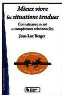
• MIEUX VIVRE LES SITUATIONS TENDUES Connaissance de soi et compétences relationnelles Jean-Luc Berger Jean-Luc Berger, Éd. Chronique Sociale, 2014.

Face aux situations de tensions ou à des difficultés relationnelles, il arrive souvent que les mots et les intentions ne soient pas suffisants. La maîtrise d'une certaine méthode pour renouer ces relations qui s'effritent sera alors une aide précieuse. L'objectif de cet ouvrage et de son auteur est justement de partager une approche didactique pour reconstruire la relation. À partir d'exemples concrets et de leur analyse, on construit une vision plus claire de la situation, de ces enjeux, des vécus et des ressentis afin de définir les modalités d'action adaptées pour tenter de reprendre le dialogue avec l'autre. Ce travail passe nécessairement par un temps de compréhension de soi, car chacun porte sa responsabilité dans le conflit et dans sa dégradation ou de son amélioration ! Certaines qualités relationnelles peuvent être travaillées et améliorées pour favoriser des relations plus harmonieuses.