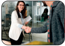
TABLEAU DES CONTENUS DÉTAILLÉ